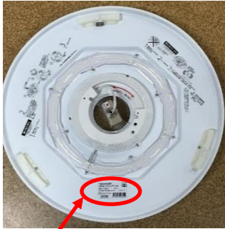
シーリングライト