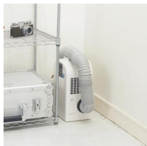
コンパクトサイズ