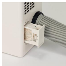
クレベリンLED カートリッジ