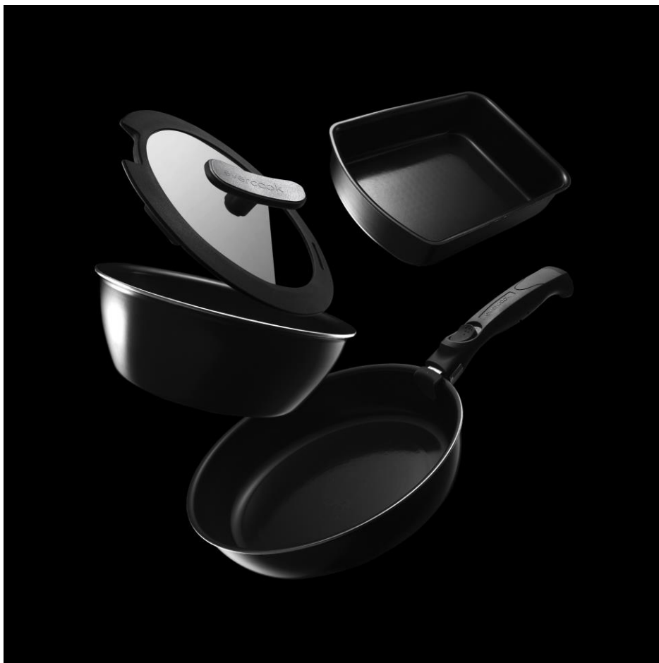
evercook α 備長炭 5点セット

株式会社ドウシシャ(大阪本社：大阪市中央区、代表取締役社長：野村 正幸)は、2年保証のフライパン『evercook “α (アルファ)”』より「evercook α 備長炭 5点セット」を、2017年9月下旬に発売いたしました。