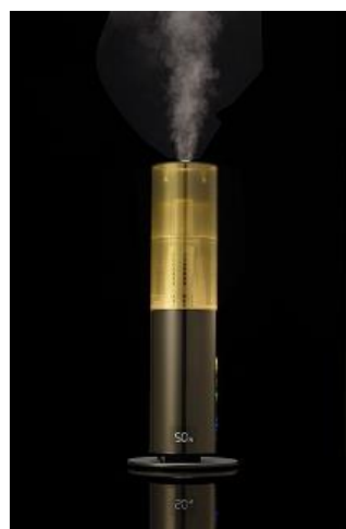
LEDイルミネーション