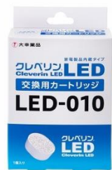
交換用クレベリンLEDカートリッジ