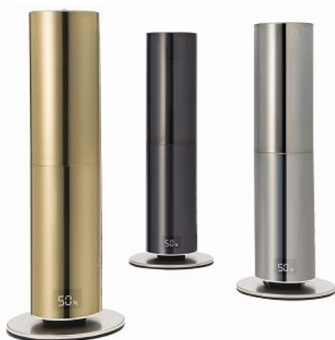
「クレベリンLED搭載 moodハイブリッド式加湿器」 ゴールド(左) ブラック(中) シルバー(右)

給水は本体上部から簡単に出来ますので、水タンクを取り外す手間が省け、大変便利です。抗菌カートリッジには、水道水のミネラル分を吸着するゼオライトを搭載しています。抗菌されたきれいなミストを発生します。