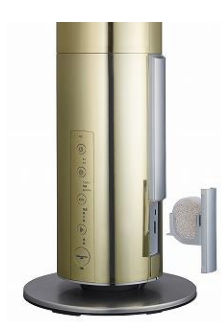
操作部及びクレベリンLED部分