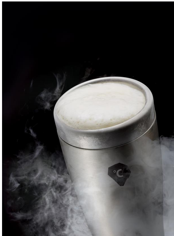
フリージング ステンレスタンブラー

商品 URL： http://www.do-cooking.com/freezing/index.html