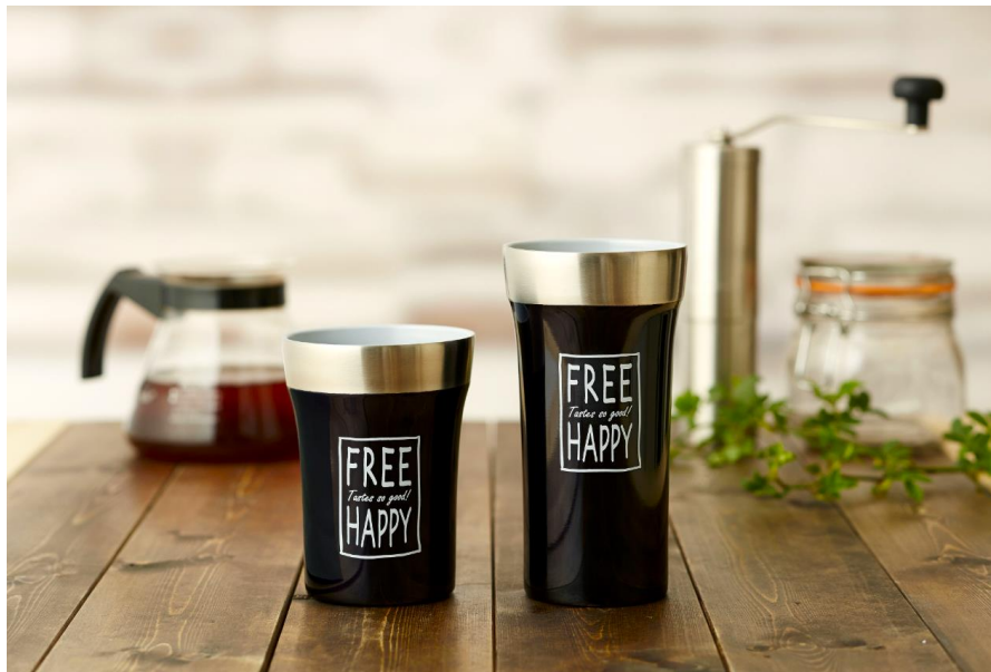
飲みごろタンブラー DST-T

商品 URL： http://www.do-cooking.com/nomigoro_dst-t/index.html