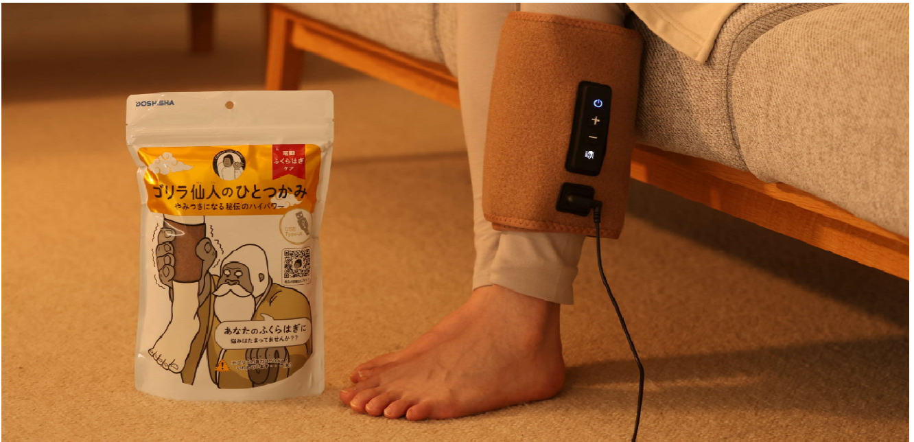
「ゴリラ仙人のひとつかみ」

URL： https://e-doshisha.com/hanako/gorilla_sennin_hitotsukami/