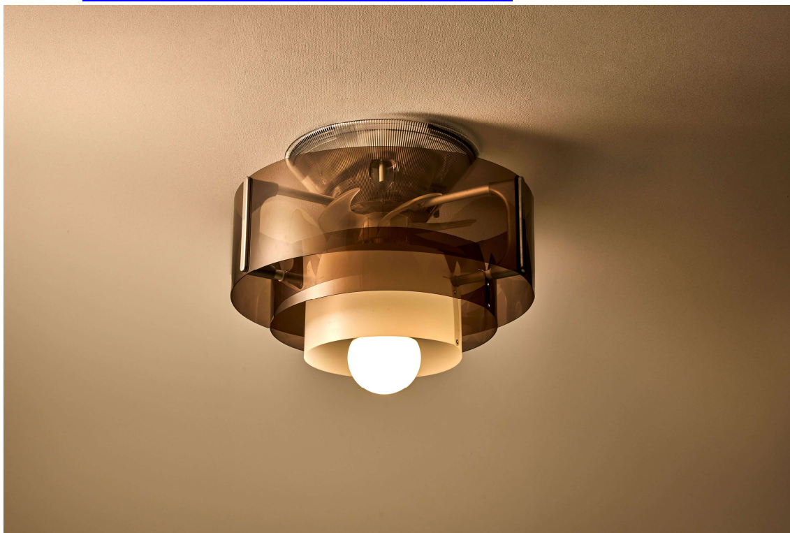
「サーキュライト HELIX (ヘリックス)」

Makuake URL : https://www.makuake.com/project/helix_01