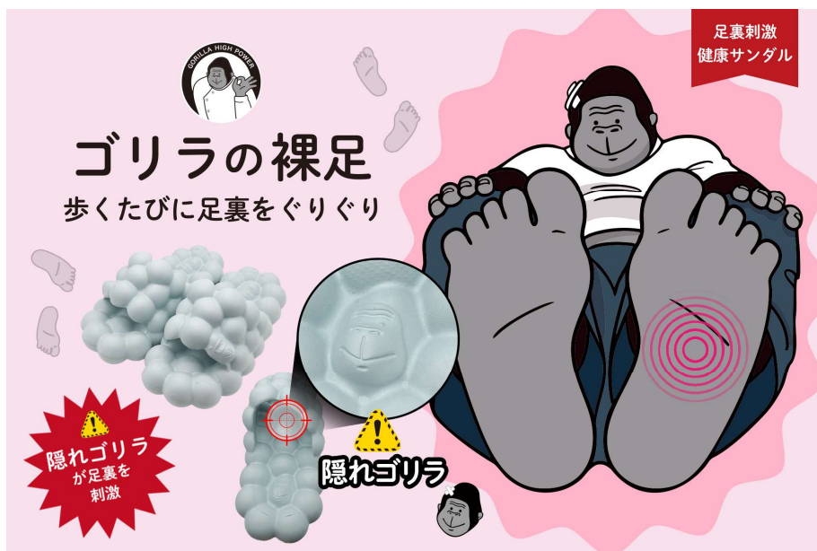
足裏を刺激する健康サンダル「ゴリラの裸足（はだし）」