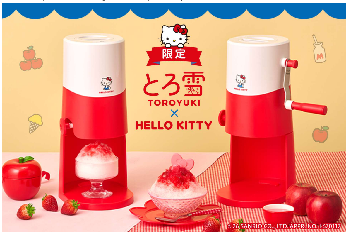
とろ雪かき氷器のハローキティデザイン（左：電動、右：手動）

URL：(電動) https://do-cooking.com/toroyuki/dts-b5/ (手動) https://do-cooking.com/toroyuki/is-ty-b5/