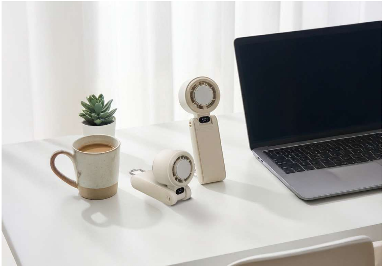
3WAY+アイス大風量ハンディファン

URL： https://e-doshisha.com/lineup/handyfan_jfsb-42b.html