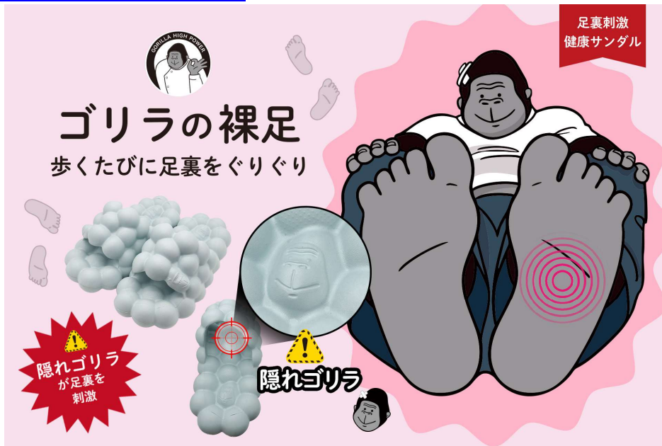
足裏を刺激する健康サンダル「ゴリラの裸足（はだし）」