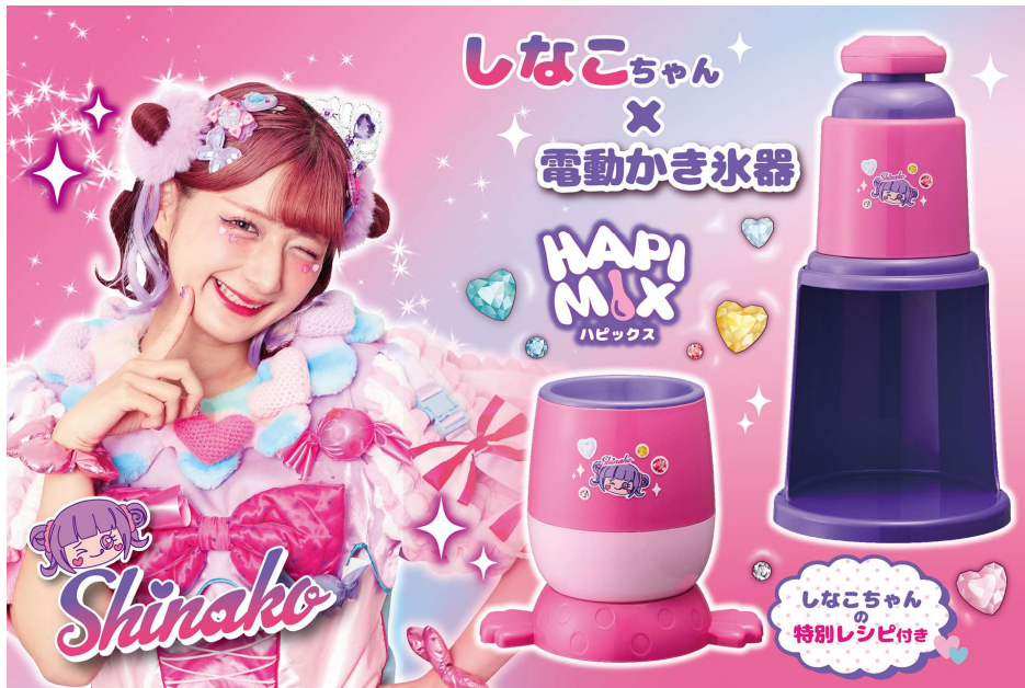
しなこちゃん×電動かき氷器/しなこちゃん×HAPI MIX (ハピックス)

商品ページ URL : https://do-cooking.com/koorikaki/ ・ https://do-cooking.com/hapimix/