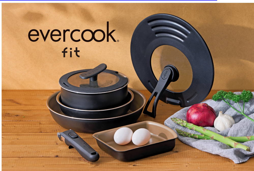
「evercook fit（エバークックフィット） フライパンセット」

URL： https://www.doshisha-marche.jp/c/brand/evercook/evercook_fit