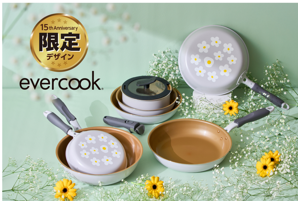
「evercook フライパン 15 周年限定デザイン」

URL : https://www.doshisha-marche.jp/c/lifestyle/LS-FP-15th