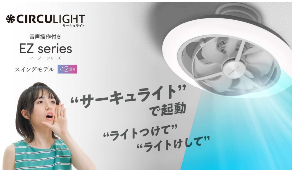
サーキュライト EZシリーズ スイング 12畳 音声操作モデル

URL : https://circulight.com/ez-voice-swing/