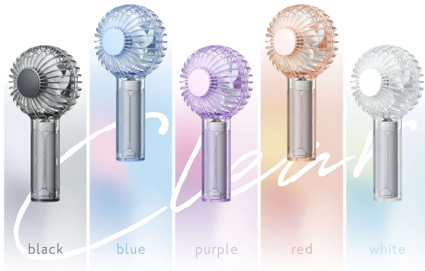
二枚羽根大風量クリアハンディファン

URL： https://e-doshisha.com/lineup/handyfan_fsa-54b.html