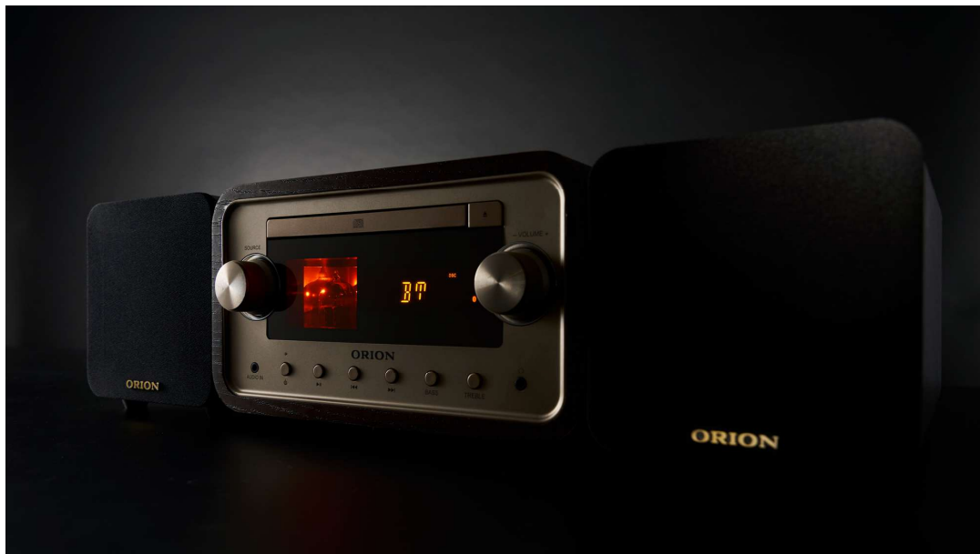
ORION Bluetooth®機能搭載真空管ハイブリッドアンプ CD ステレオ

URL : https://doshisha-av.com/audio/otona-audio2/