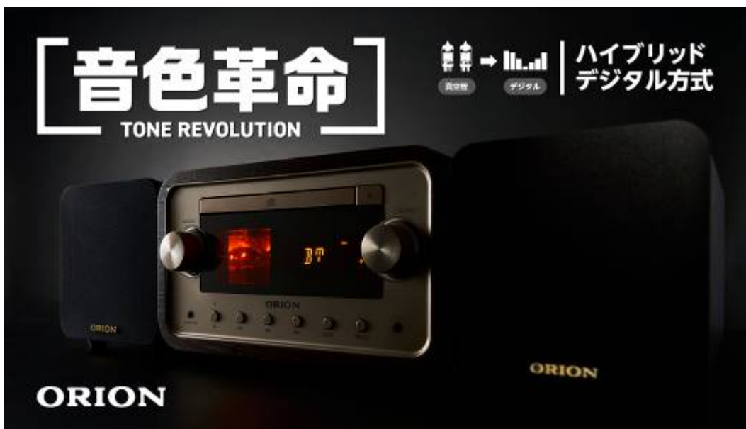
ORION Bluetooth®機能搭載真空管ハイブリッドアンプ CD ステレオ

URL： https://www.makuake.com/project/orion_cd_stereo/