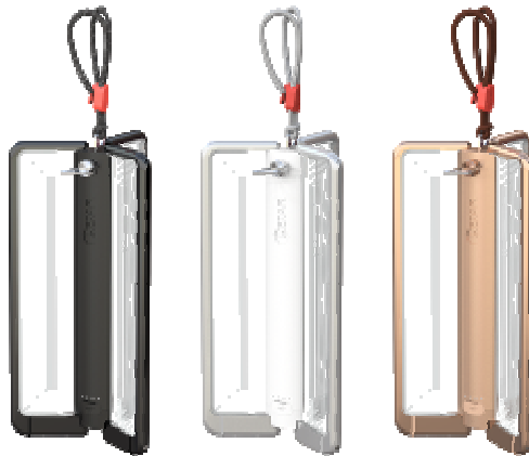
左 : ブラック、中央 : ホワイト、右 : コッパー

品名 : 導光パネル LED ランタン HEXAR (ヘキサー) CL6 カラー : ブラック、ホワイト、コッパー 本体寸法 : 約 105×212×93mm (使用時) / 約 30×212×80mm (収納時) 本体質量 : 約 390g(ストラップ・バッテリー含む) 光束 : 15~600lm 点灯時間 : 約 300h(15lm 使用時) / 約 6.5h(600lm 使用時) 調光 : 無段階 発光 : 電球色 (3000k) バッテリー : リチウムイオン充電電池 6,000mAh 充電 : USB Type-C(ケーブル付属) 充電時間 : 約 4.5h(5V/2A) 動作温度 : 0℃~40℃ 保護等級 : IP54 付属品 : ケース、Type-C コード 製品ページ : https://www.doshisha-led.com/hexar-cl6/ ブランドページ : https://www.doshisha-led.com/hexar/