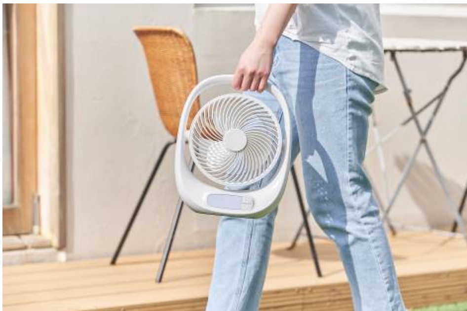
ポータブルファン

URL： https://e-doshisha.com/lineup/portablefan_fbz-160b.html