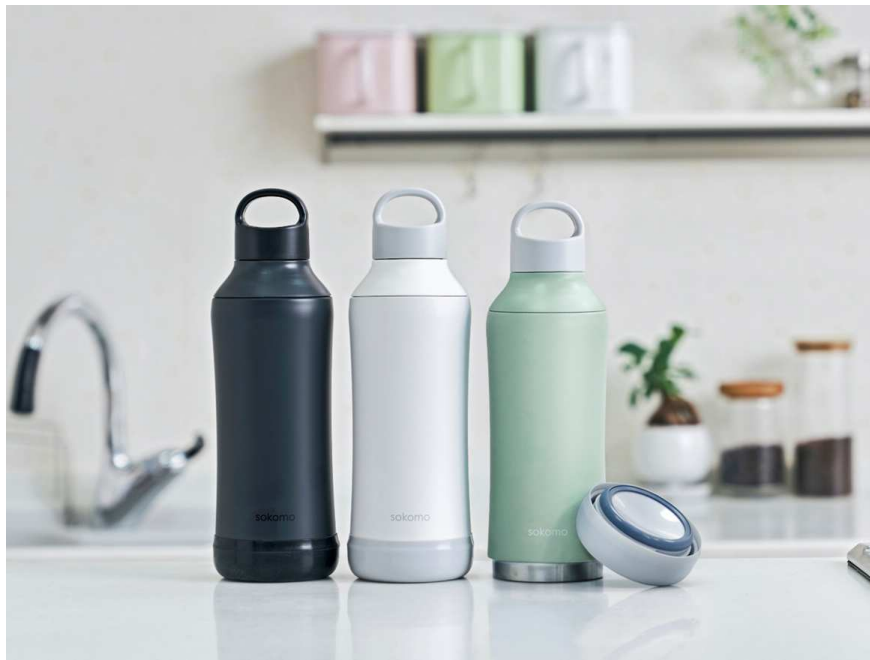
sokomo そこまで洗えるボトル

URL : https://do-cooking.com/sokomo/index.html