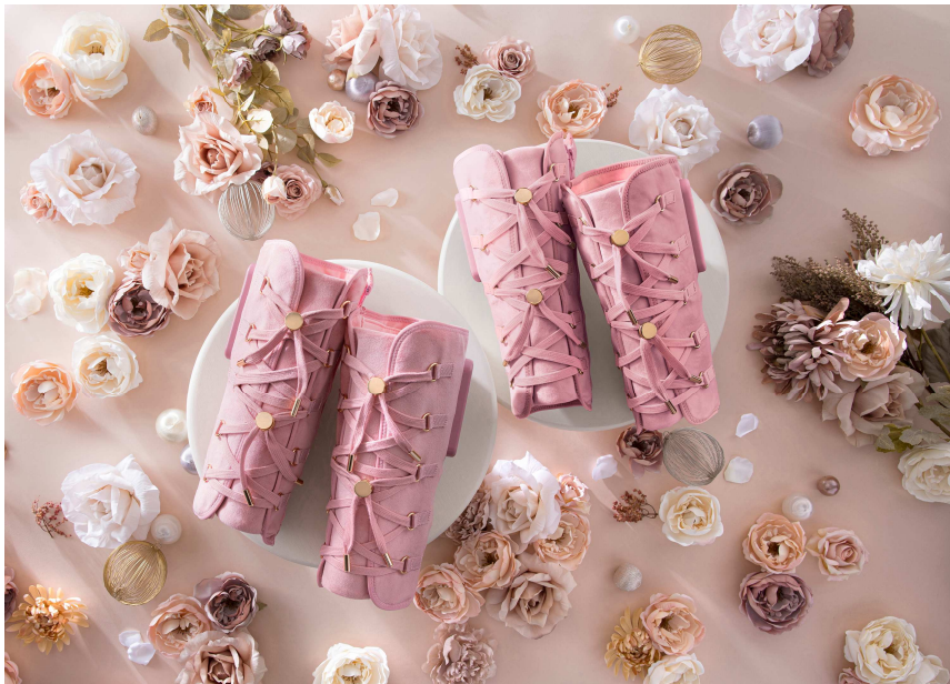
I my me (アイマイミー) ふくらはぎケア スラットレッグ

URL : https://www.doshisha-marche.jp/f/imyme