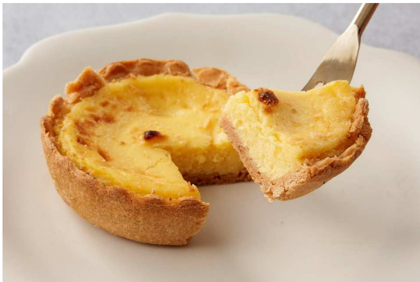
おいも生フロマーージュタルト【1個】 486円（税込）※要冷蔵