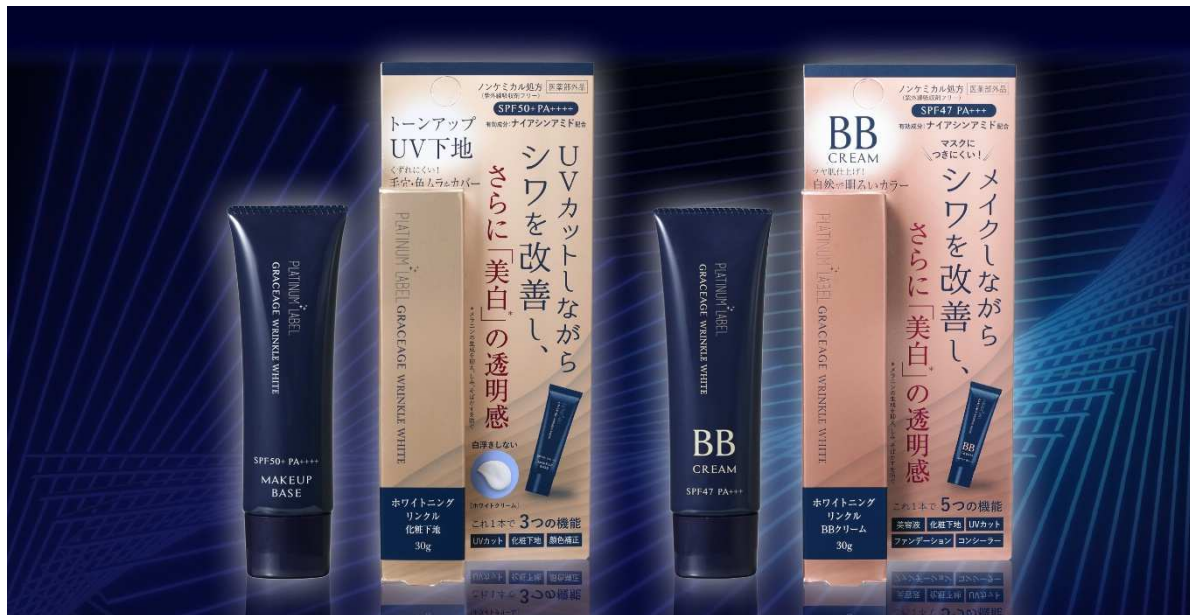
シワ改善・美白(*1)を叶える“薬用ホワイトニングリクル”トーンアップ UV 下地&BB クリーム【医薬部外品】

生活関連用品の企画・開発・販売を行う株式会社ドウシシャ(大阪本社:大阪府中央区、代表取締役社長:野村 正幸)は、プラチナレーベルグレージュから発売中の、『シワ改善』と『美白(*1)』の両方のケアを叶える“薬用ホワイトニングリクル”シリーズに、「トーンアップ UV 下地」と「BB クリーム」の2アイテムを加え、2023年3月10日(金)より販売開始します。