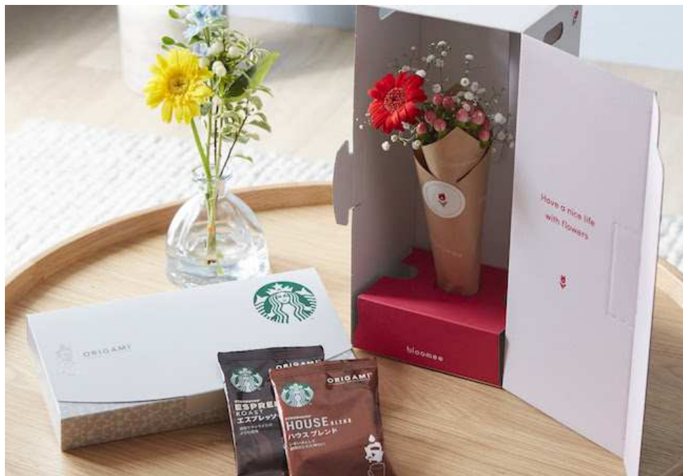
ブルーミーのお花&スターバックスドリップ

第一弾として、お花のある生活とコーヒーをテーマに「季節のお花」と「スターバックスコーヒーギフト」を一緒にお届けするサービスを展開します。