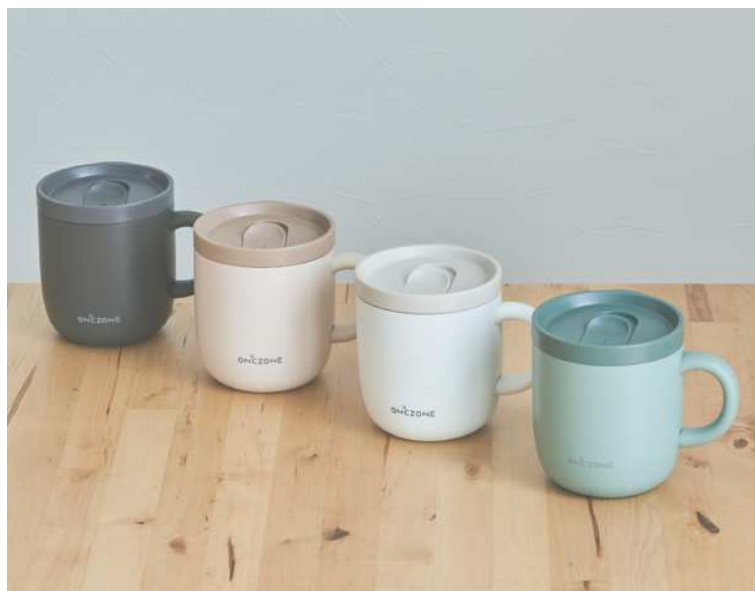
「猫舌専科マグカップ」

商品 URL : https://www.do-cooking.com/nekojitasenka/