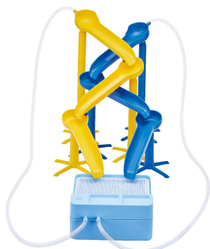
ジグザグクロスコース