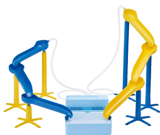
ガンガンアップコース