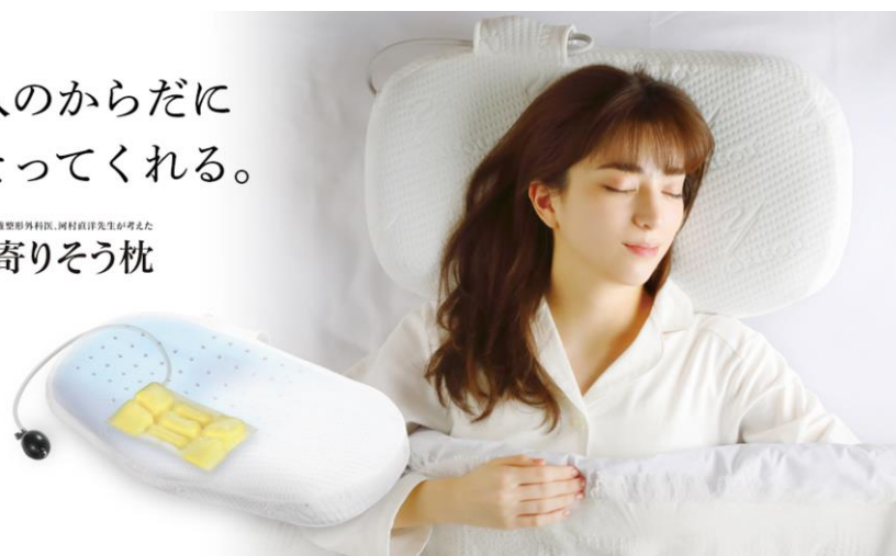
首と肩に寄りそう枕