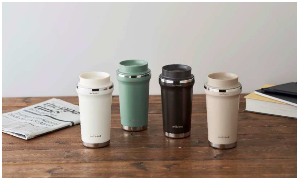
「猫舌専科タンブラー」発売

商品 URL : https://www.do-cooking.com/nekojitasenka/