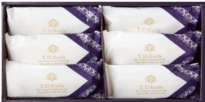
FONDANT FROMAGE 6個入り ¥756 (税込み)

チーズパウダーを加えて焼き上げたクッキー生地に、クリーミーでやさしい味わいのホワイトチョコレートをつまみ込みました。さくさくのクッキーとなめらかなチョコレートが織りなす新食感と奥深い味わいをお楽しみください。