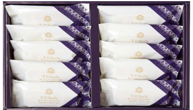
FONDANT FROMAGE 10個入り ¥1188 (税込み)