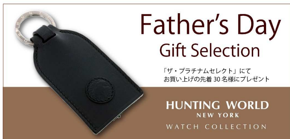
Hunting World (ハンティング・ワールド) 腕時計コレクション 「Father's Day Gift Selection」ギフトキャンペーン

詳細は『ザ・プラチナムセレクト』( https://the-platinum-select.jp/topics_detail.html?info_id=88 )をご参照ください。