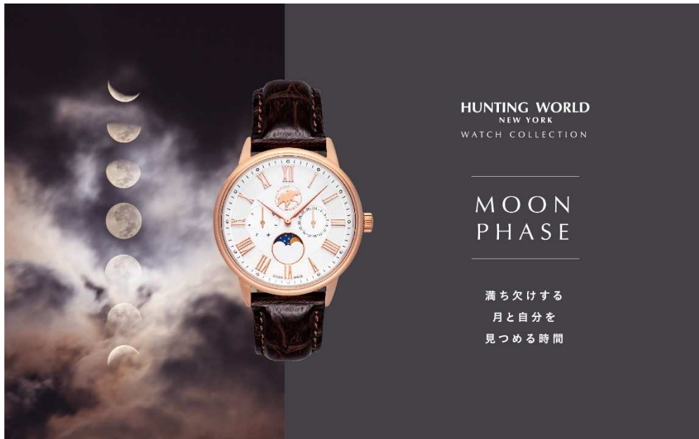
Hunting World (ハンティング・ワールド) 腕時計コレクション公式HPより 「HWM010 ムーンフェイズ」55,000円(税別)

公式サイト URL : https://www.huntingworld-watch.com/