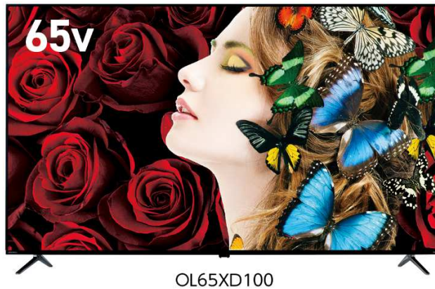
ORION 65型 BS4K・110度CS4Kチューナー内蔵液晶テレビ OL65XD100

本製品は、モノづくりの街である福井県越前市にあるドウシシャ R&D センターで自社設計し、グループ会社であるオリオン株式会社の協力のもと作り上げました。日本人の繊細さと正確さを凝縮し、シンプルな仕様ながらも高画質・高品質で且つ価格にもこだわった製品となっています。