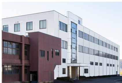
ドウシヤ R&D センター建屋