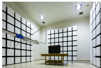
EMC サイト テストラボ