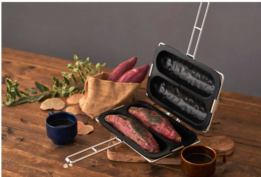
『ホクホク焼き芋プレート』