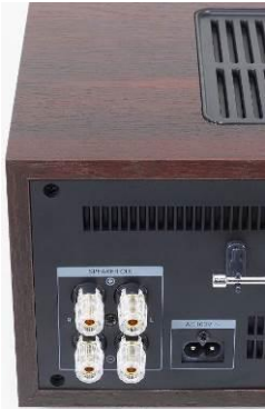
・ 本体、スピーカーのバナナプラグ対応端子