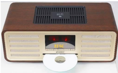
・フロントローディング CD メカ