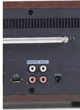
・ 多彩な背面入力端子