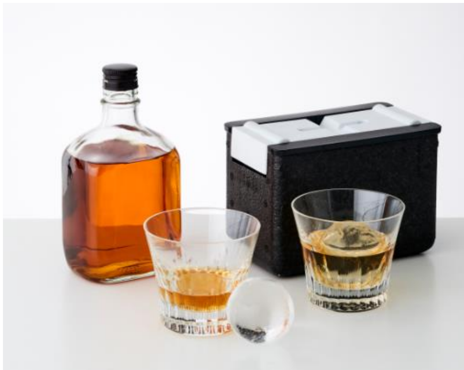
『大人の透明まる氷』

近年、世界的にウイスキーが人気になっています。バーなどでウイスキーを飲むときに出てくる丸くて透明な氷がありますが、それに対する憧れに着目し、自宅で透明な氷を作ることのできる『大人の透明まる氷』を発売します。