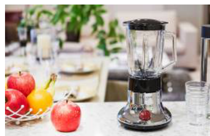
ブラックチタンミル&ミキサー