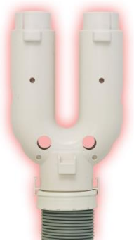
大型ふとん乾燥 アタッチメント