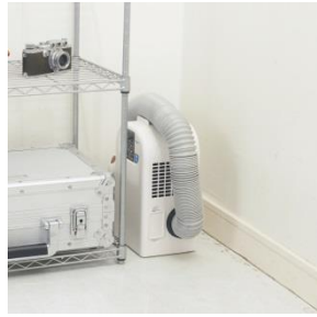
コンパクトサイズ