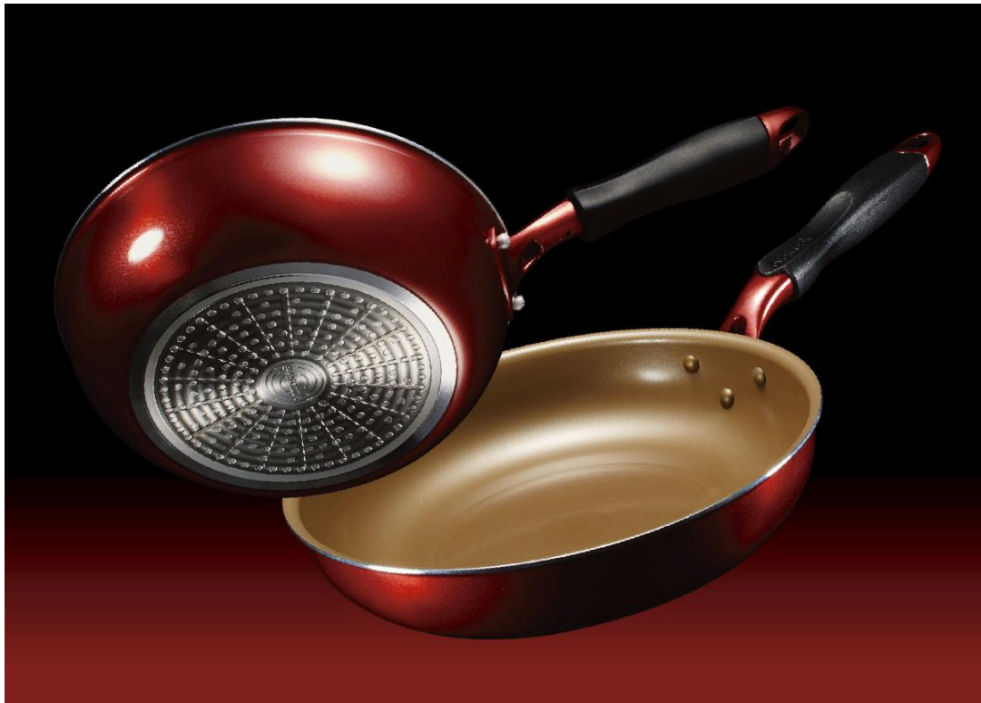
evercook “ \alpha （アルファ）”