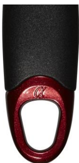
持ち手には \alpha マーク入り

また、内面はツルすべゴールドコーティングはそのままに、 \alpha ダイヤ粒子を入れることにより、更に内面のゴールドが際立ちました。